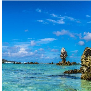
Coral formations in Anibare bay. Nauru. Ausschnitt (CC BY 2.0)