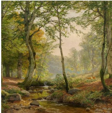
Waldlichtung mit Wildbach (Ausschnitt). Heinrich Boehmer (1930)