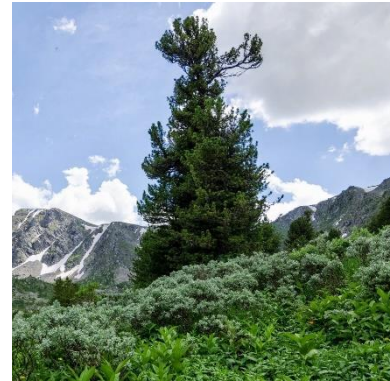
Pinus Sibirica. Altai Republic. Russia. Ausschnitt (CC BY 3.0)